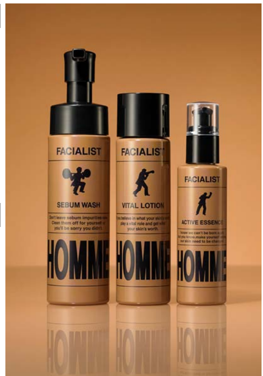
(写真左から)シーバムウォッシュ、バイタルローション、アクティブエッセンス

【Step1】洗う「フェイシャルリストオム シーバムウォッシュ」(泡洗顔料)、 【Step2】潤す「フェイシャルリストオム バイタルローション」(化粧水)、 【Step3】与える「フェイシャルリストオム アクティブエッセンス」(美容液)の 3 ステップで、生き生きと輝き続ける自信に満ちた肌へと導きます。