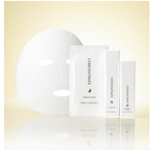
(写真左から) 「シーボン コンセントレート エッセンスマスク」 「シーボン コンセントレート ハイドレーター」 「シーボン コンセントレート リファイニングセラム」

今回は、バージョンアップ第一弾として、導入美容液、美容液、パックの3アイテムを発売します。