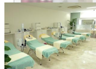
シーボン、フェイシャルistサロン