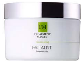
クリームの色で汚れ落ちが一目瞭然

クレンジングも化粧水や美容液といったほかのスキンケアアイテムと同じように、年齢や肌質、季節に応じて自分に合うアイテムを探すことが大切です。季節の変わり目や、本格的に寒くなり、乾燥も気になるこれからの季節。肌の調子がいつもと違うなと感じたら、スキンケアの最初のステップであるクレンジングから見直してみてもいかがでしょうか。