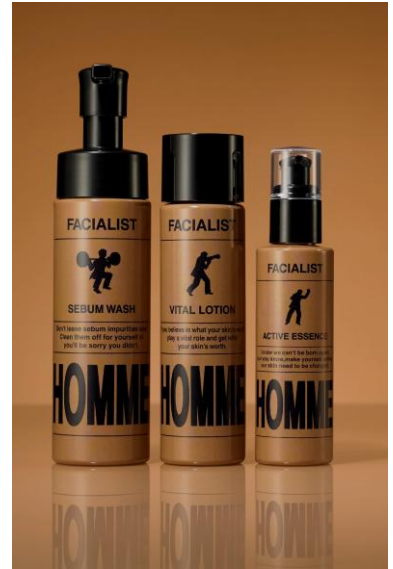
(写真左から)シーバムウォッシュ、 バイタルローション、アクティブエッセンス